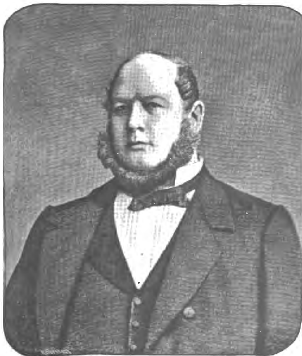
Н. Н. Мурзакевичъ, Вице Предсѣдатель Импер. Новороссійскаго Общества Исторіи и древностей † 1883.