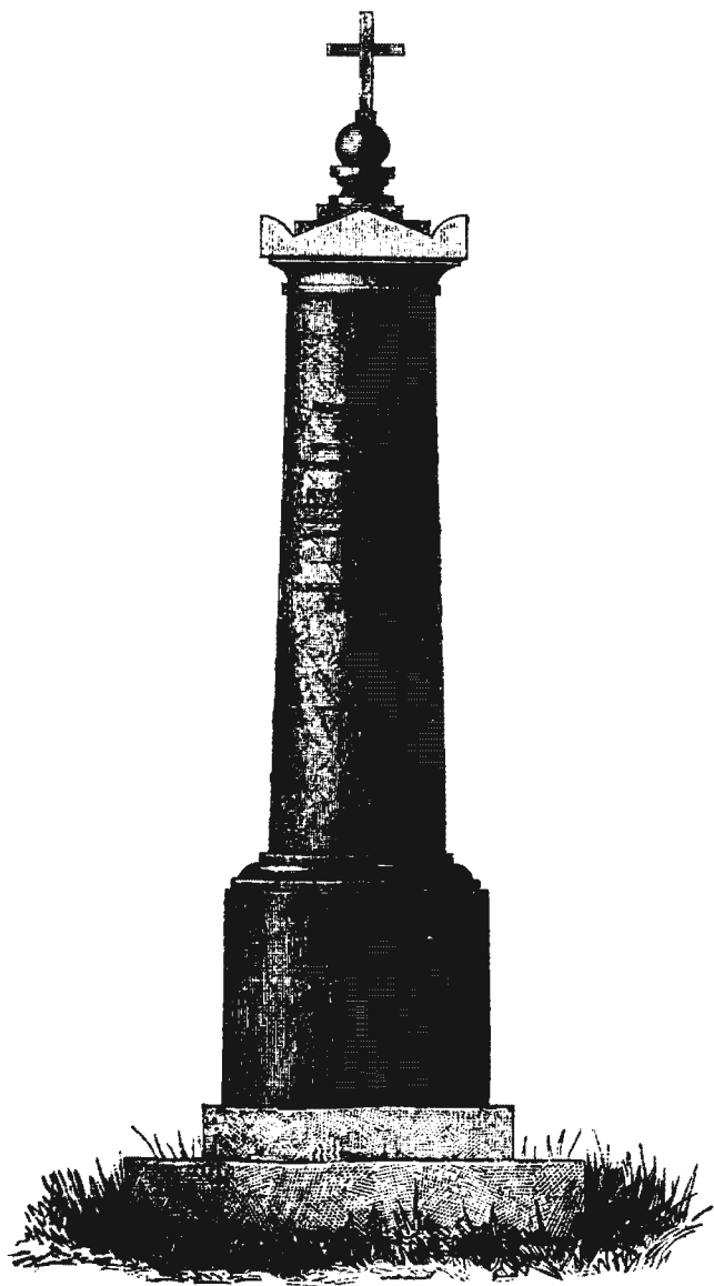
НА МОГИЛЪ А. М. ВУЛАНОВА † 19 янв. 1826 г.